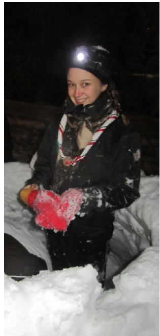
Sara vuosi sitten Sveitsissä iglunrakennupuuhiissa

Katellaa, mitä tää pesti saa aikaan. Huikiaa juhlavuotta kaikille!