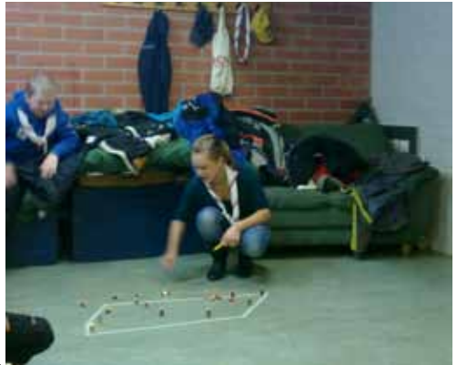
Katapultteja testailtiin ampumalla kumoon urheita Lego-ukkoarmeijoita.

Ennen joulua teimme tietysti myös kynttilöitä.