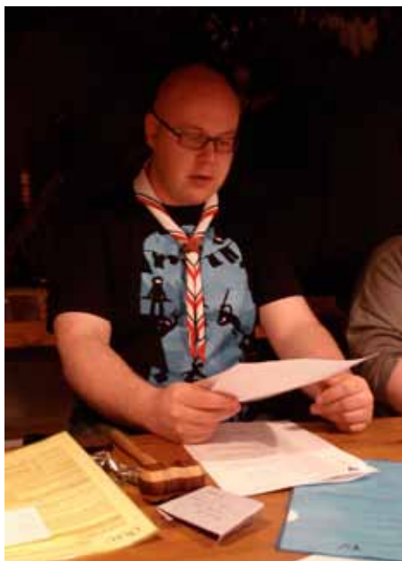
LPKJ ja jokamaanantainen paperipar- tiointi, Johtajaneuvoston kokous.

Laadukkaan toiminnan ylläpitäminen on jatkuva haaste.