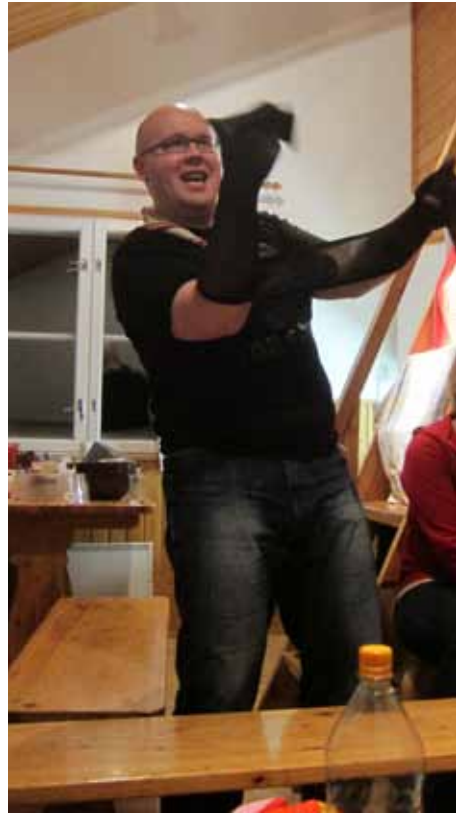
Timo ja Minuuttipelin sukkahousubaaste Hyppysä Tuntemattomaan

TERVEISESI POHJAN TÄHDEN LUKIJOILLE: Pui pui!